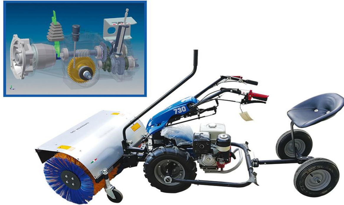
设备 BCS系列意大利除雪机