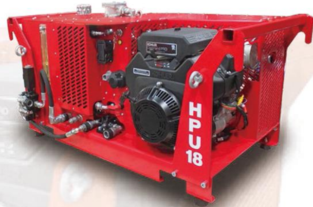
设备 液压动力单元