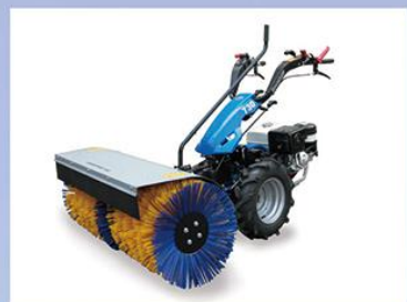
手扶式多功能扫雪机