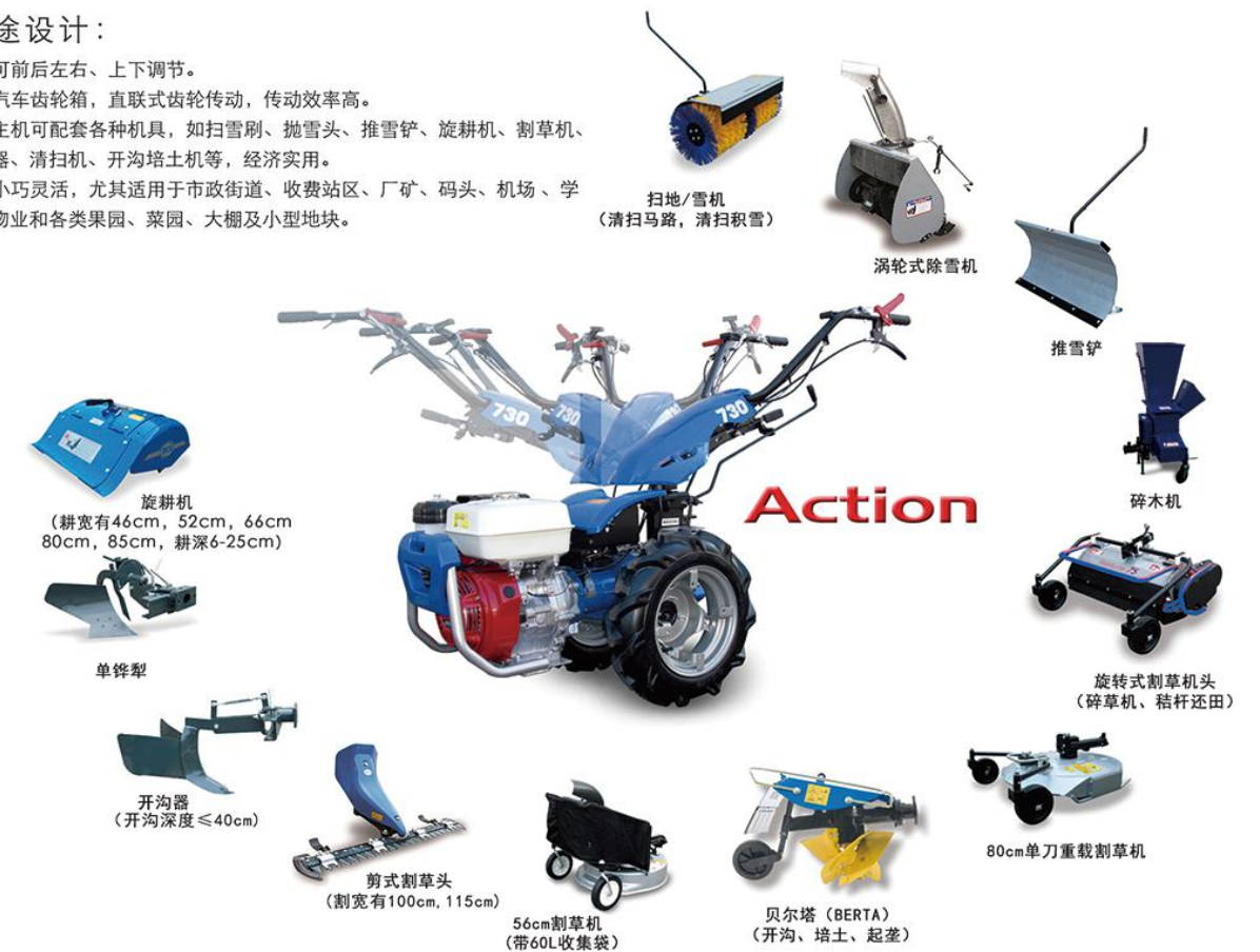
扫地/雪机 (清扫马路,清扫积雪)