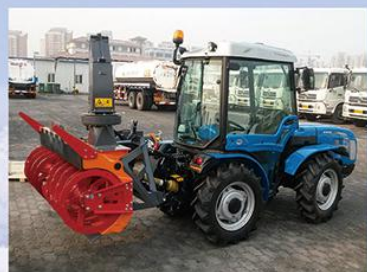
驾驶式多功能抛雪机