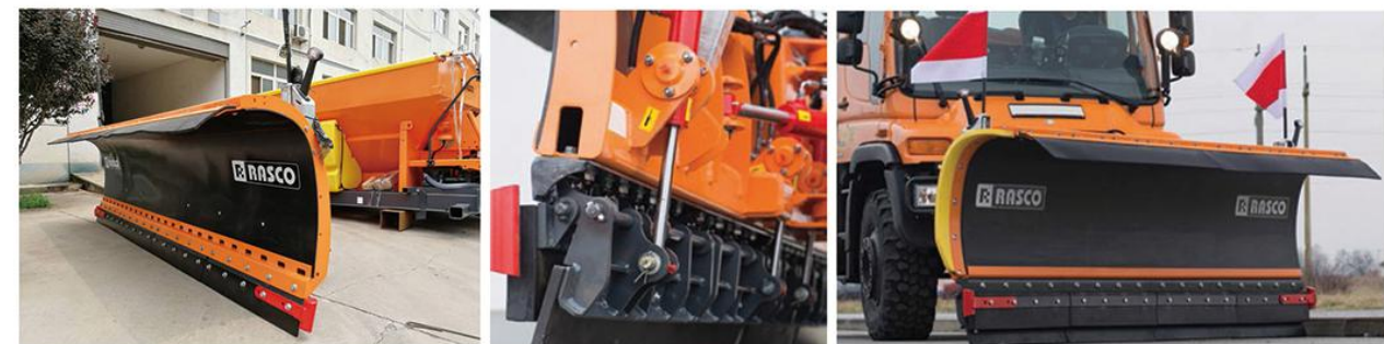
设备 MSP双铲刀推雪板