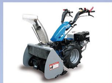
手扶式多功能抛雪机