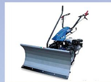
手扶式多功能推雪机