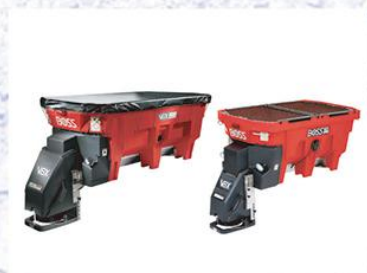
耐腐蚀聚脂撒布机